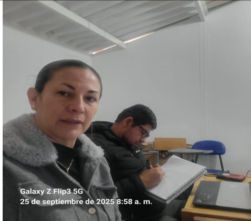
Imagen 1: semana de inducción institucional